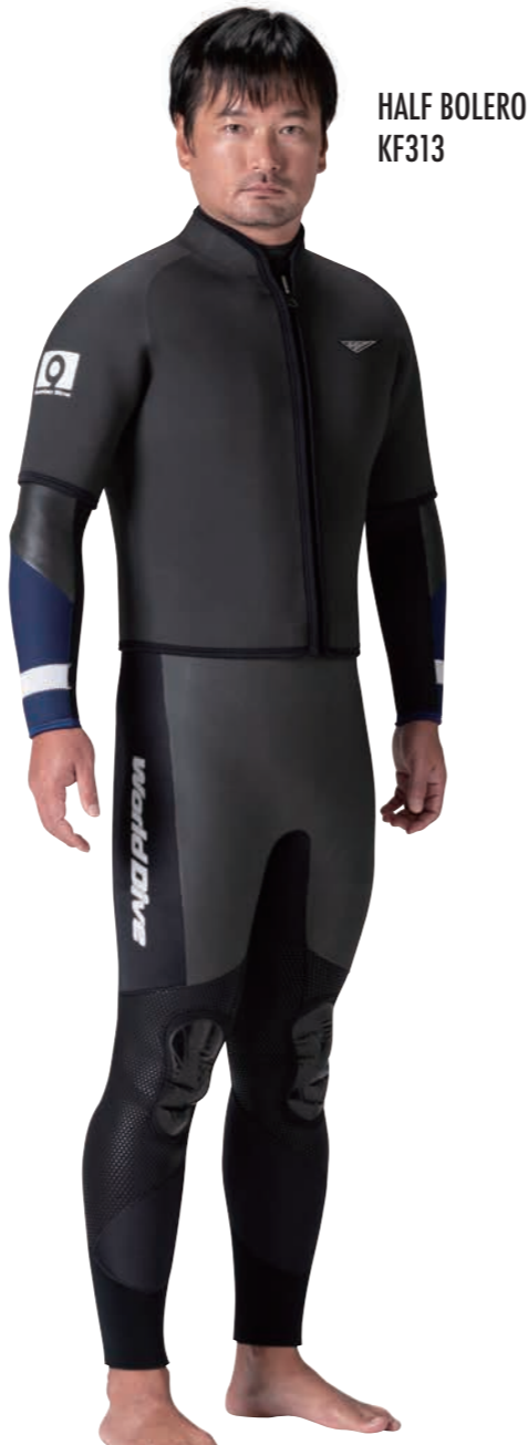
PRICE② ワンピース+ハーフボレロ

▲シャドウスキン・カモ×ネイビー(タフα)×ホワイト(GME)×ブラック(GME)×ブラック(GME)×ブラック(ZF)