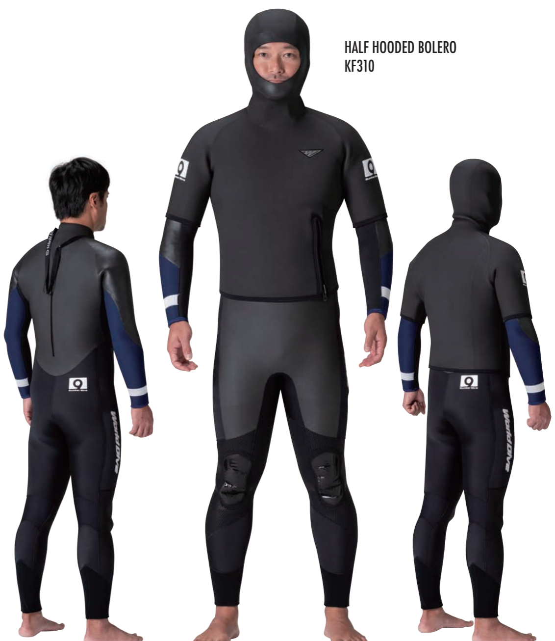
PRICE③ ワンピース+ハーフフードボレロ

▲シャドウスキン・カモ×ネイビー(タフα)×ホワイト(GME)×ブラック(GME)×ブラック(GME)×ブラック(ZF)