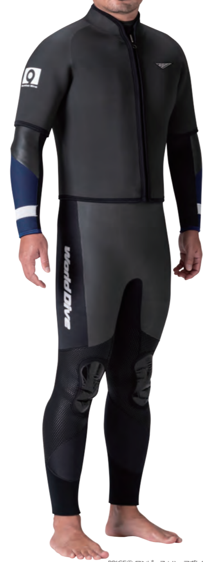
PRICE② ワンピース+ハーフボレロ

▲シャドウスキン・カモ×ネイビー (タフα) ×ホワイト (GME) ×ブラック (GME) ×ブラック (GME) ×ブラック (ZP)