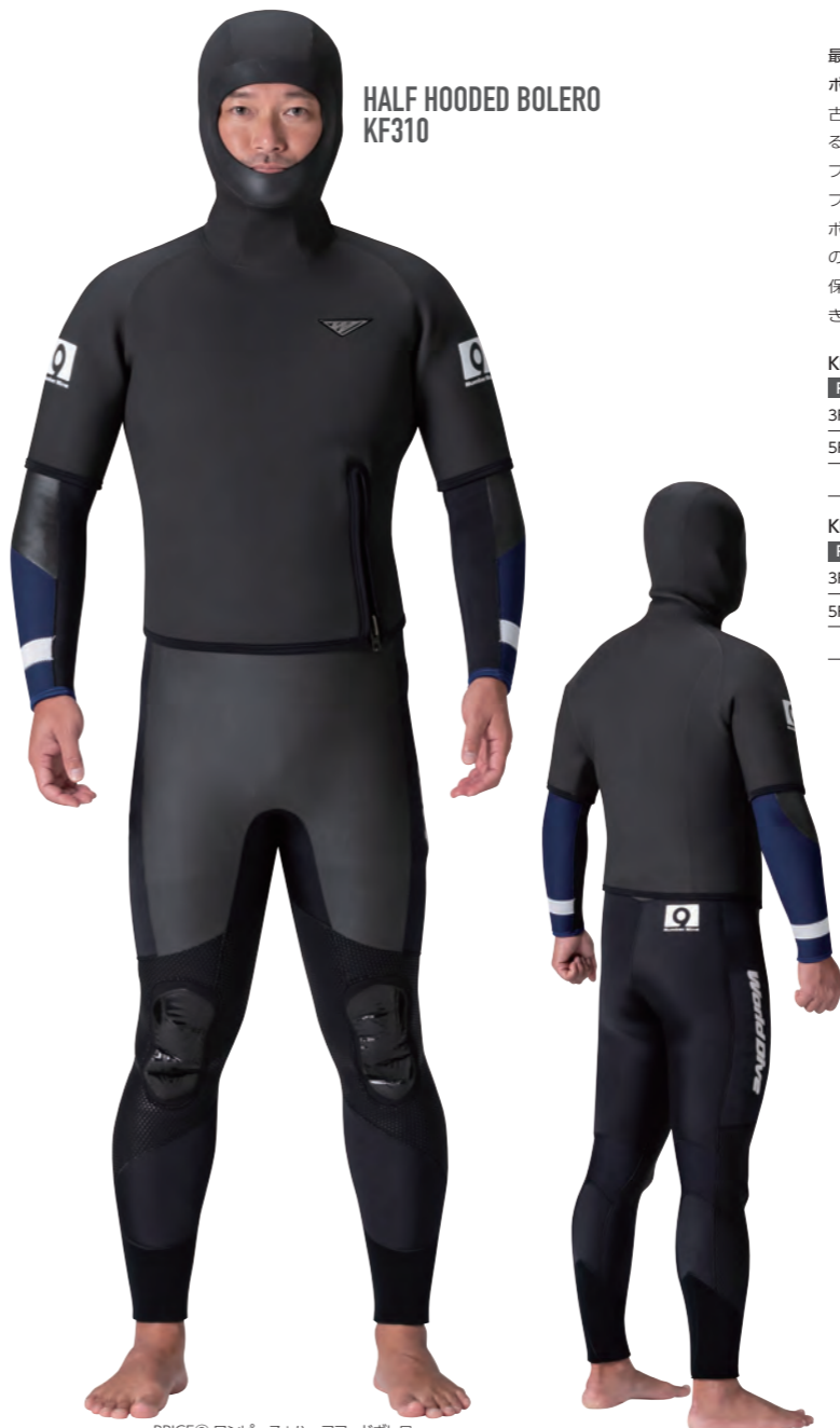
PRICE③ ワンピース+ハーフフードボレロ

▲シャドウスキン・カモ×ネイビー (タフα) ×ホワイト (GME) ×ブラック (GME) ×ブラック (GME) ×ブラック (ZP)