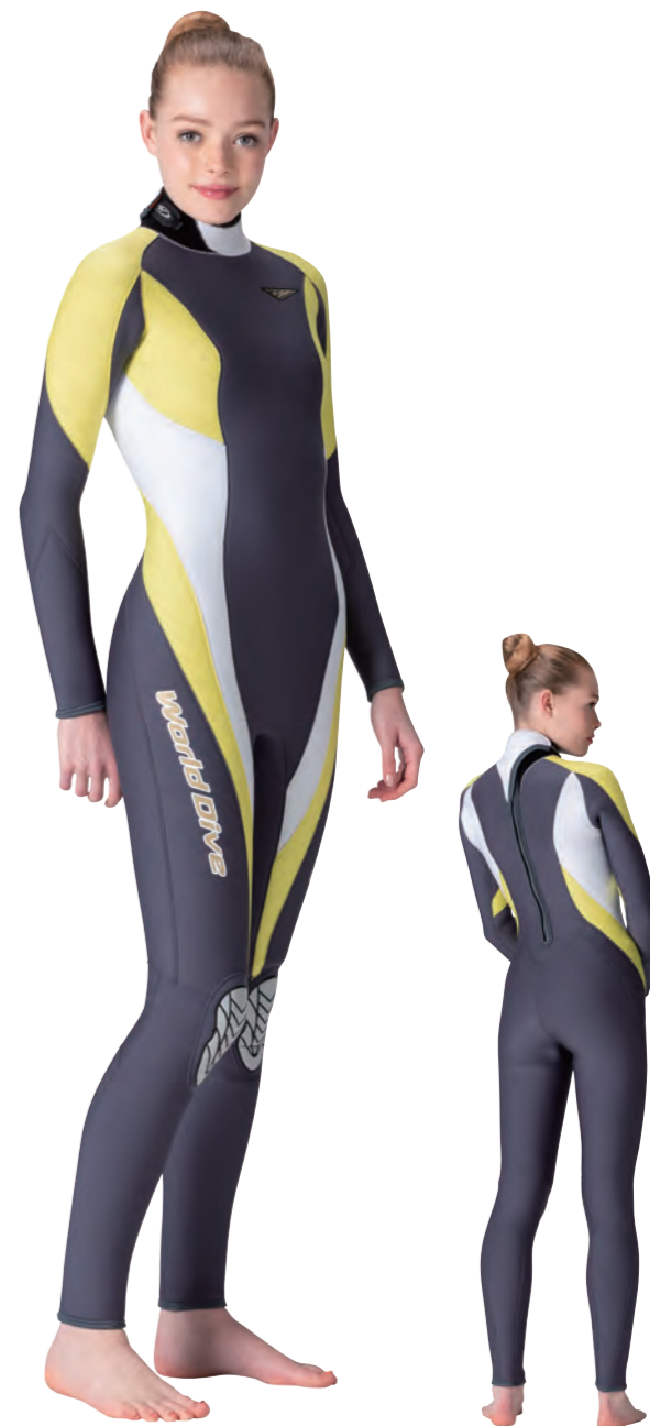
▲チャコールグレイ (FE) × イエロー (FE) × ホワイト (FE)