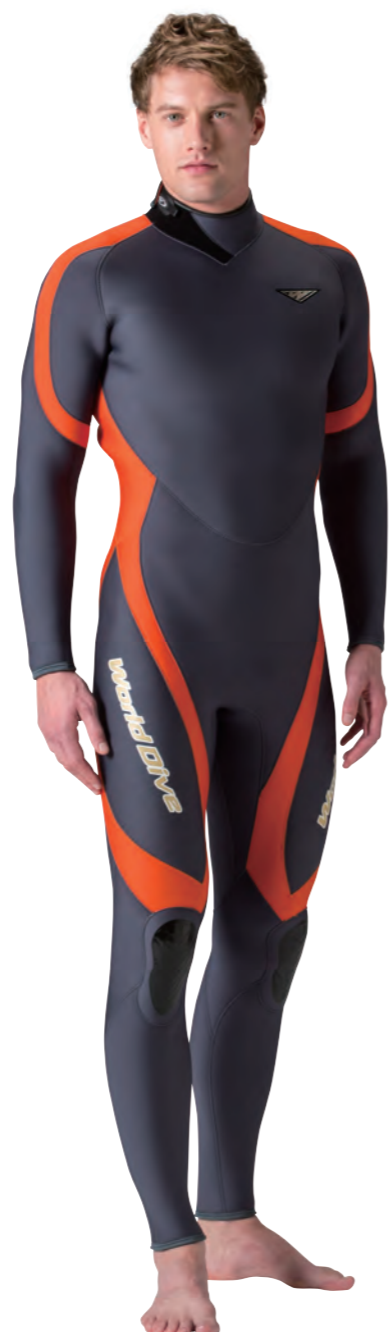
▲チャコールグレイ (FE) × オレンジ (FE)