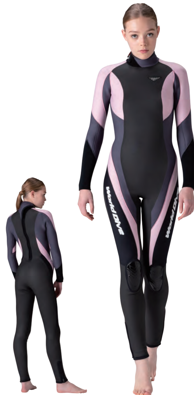
▲ピーチ (FE) × チャコールグレイ (FE) ※足首ファスナー標準装備