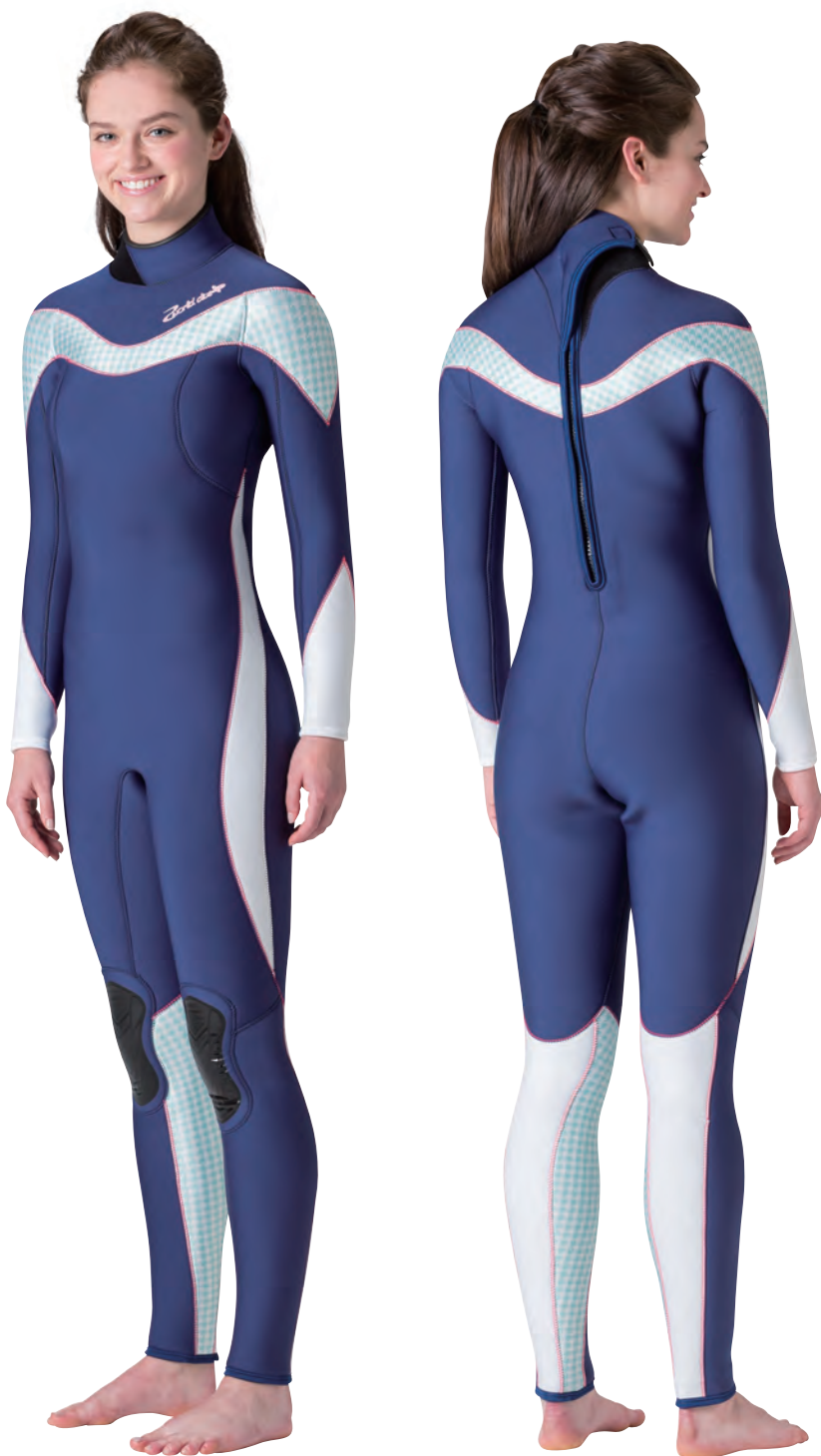
▲ネイビー (FE) × チドリライトグリーン (P) × ホワイト (FE) × 部分ステッチ・ローズ

肩から胸をラウンドするラインと、ウエストサイド、腕に流れるカーブラインが女性らしいシルエットを演出するWOMENS専用デザイン。プリント柄と部分ステッチカラーをうまくコーディネートすれば、フェミニンダイバーの誕生です。