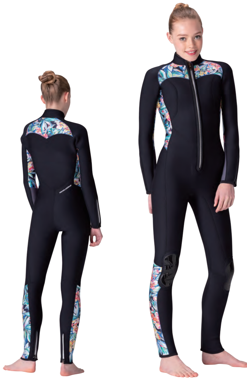
▲ブラック (FE) × トロピカル (P) × チャコールグレイ (FE) フロントファスナー・当て布・ボーダーネイビー / ファスナー・ホワイト ※手首・足首ファスナーはオプション