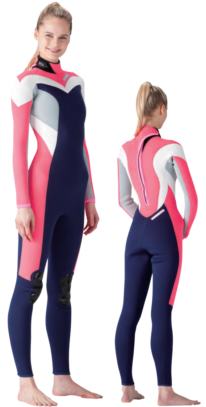
▲ネイビー (SJ) × スピンク (SJ) × ホワイト (SJ) × シルバー (SJ)

あたたかい MULTI ELASTEX OR バリュープライス STANDARD JERSEY プリント柄選べます Choice! PRINT OPTION PRINT 3リズン柄 ¥4,400 (税込)