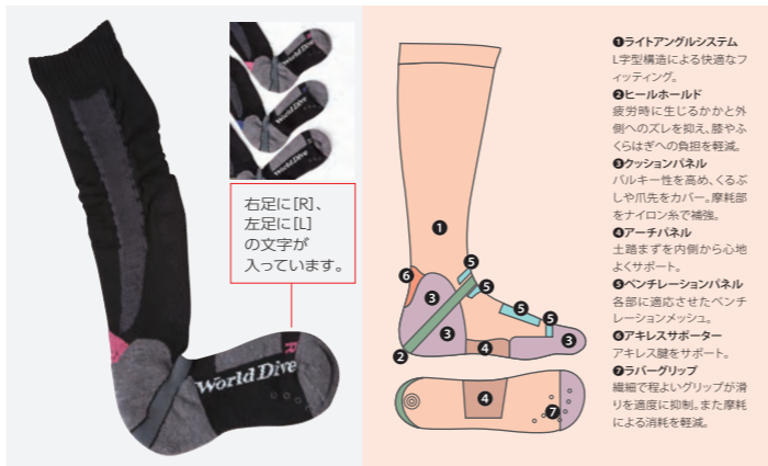
エルフィット・プラス

保温性に優れた抜群の暖かさを誇る最高級羊毛メリノウールと、L字型ヒールホールド技術で快適なフィッティングを約束するダイビング専用ソックスです。