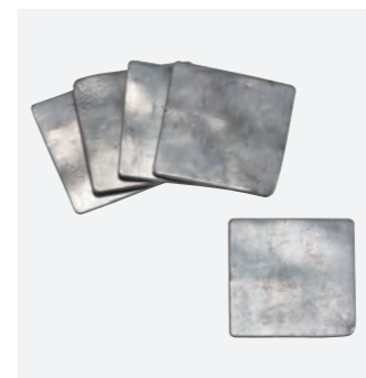
ウエイトベスト用鉛板5枚セット

■MATERIAL ●ターボリン ■COLOR ●ブラック ■SIZE ●フリールー ■ポケット数 ●5カ所 ■最大収納量 ●2.5kg (専用鉛板5枚) ※ウエイトベスト用鉛板は別売