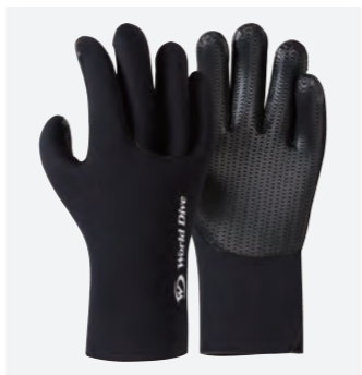
マルチヒートグローブ ver.2 : 4mm

■MATERIAL ●表素材: ファインメッシュスキン ●裏素材: ターフジャージ ■COLOR ●ブラック ■SIZE ●XS・S・M・L・XL