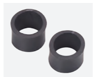
リストリング 2個1セット : ¥700 (+税)