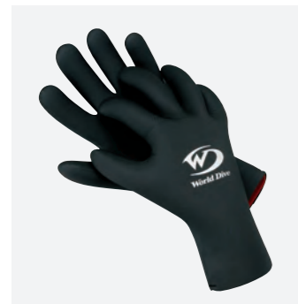
メッシュグローブ : 3mm