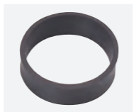
ネックリング : ¥700 (+税)