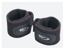
リストバンド 2個1セット : ¥1,800 (+税)