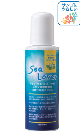
シーラバー (化粧品)