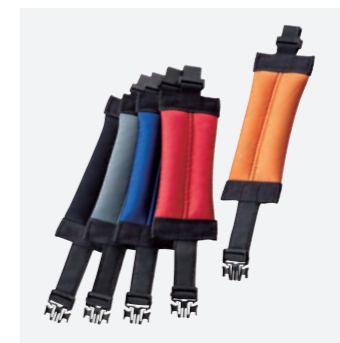
アングルウエイト