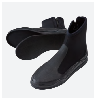
マリナーブーツ・プロユース