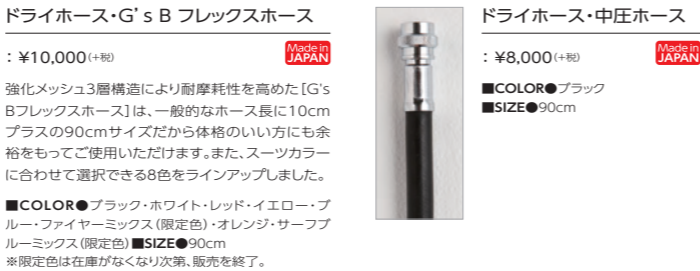
ドライホース・中圧ホース

■COLOR ●ブラック・ホワイト・レッド・イエロー・ブルー・ファイヤーミックス (限定色) ・オレンジ・サーフブルーミックス (限定色) ※