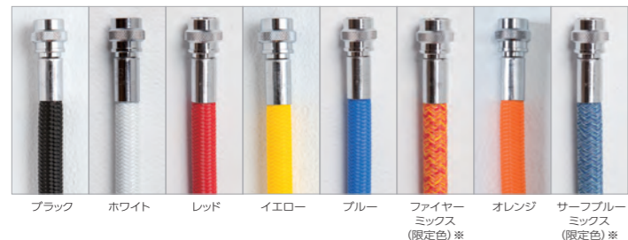
ドライホース・G's B フレックスホース