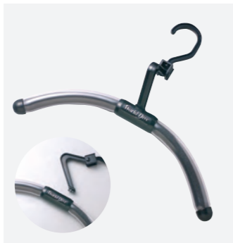
クイックハンガー

ネック部分をキープするL字フックとびつたりフィットのチューブ型パー。ダイビングスーツ専用ハンガーです。