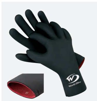
メッシュグローブ : 1mm

■MATERIAL ●表素材: ファインメッシュスキン ●裏素材: マルチエラストックス ■COLOR ●ブラック ■SIZE ●XS・S・M・L・XL