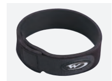
ネックバンド : ¥1,600 (+税)