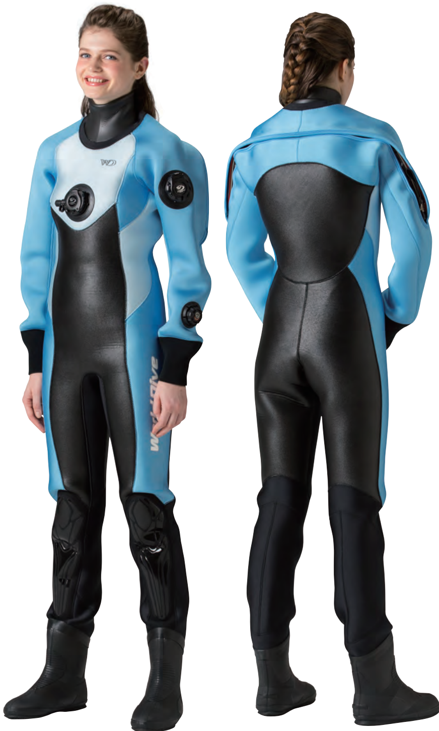
▲ウォーター(G)×アイスブルー(G)

スタイリッシュなデザインが人気のロングセラーモデル。シーズンを問わずダイビングを楽しむ、女性ダイバー向け本格派ハイクラススーツです。水キレのよいソフトラジアル、裏地には起毛保温素材マルチエラステックスの組合せで抜群の保温力を発揮します。バストからウエスト、ヒップまでのラインを美しく見せるウェーブシェイプも採用。浮力調整をサポートするリストバルブDSを標準装備。