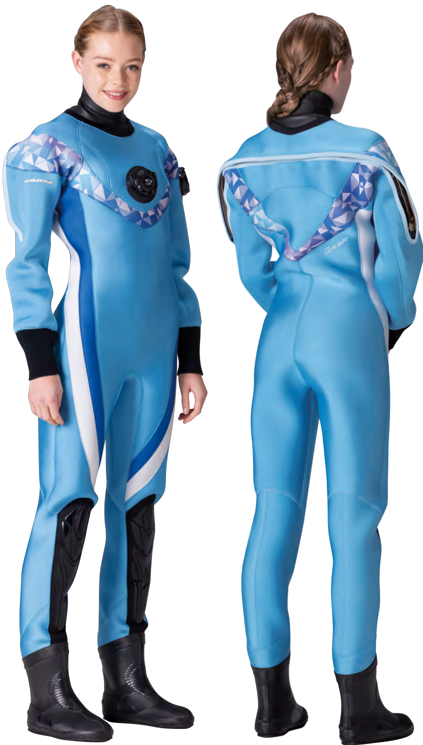
▲ウォーター(G)×トライアングルブルー(P)×ブルー(G)×ホワイト(G)×ファスナーテープ&部分ステッチ・アイスブルー

肩からフロント・バックへのVラインとサイドの2ラインで、細身ハイウエストのイメージを与えるWOMENS専用デザインです。明るくポップなカラーリングを選べばキュートな印象に。ファスナーまわりのテープカラーも選べます*。