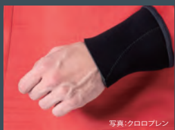
写真:クロロプレン

フィット感の良いクロロプレンでネックシールのエア溜りを抑え、なおかつシール部分を保護します。