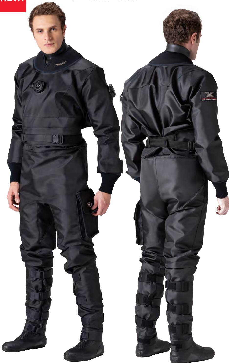
▲ブラック×ブラック ※ガーターシステムはオプション

この軽さ、新次元。シェルドライスーツは新たなステージへ。 軽量・高強度の新素材「アルティメイトクロス・ハイパー」を採用したIC9000シリーズ誕生。