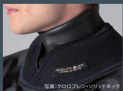
写真:クロロプレン・ソリッドネック

INTER CROSS にふさわしい渾身のパワーエキップメントと快適なダイビングを確実にサポートするWDシェルドライスーツマテリアル。