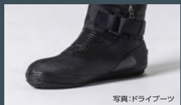
写真:ドライブーツ

太もも部には、ライトなどの小物を収納できるサイポケットを用意。内側にはメッシュのインナーポケットとDリングを装着。ポケットのフタはベルクロ仕様にして水中での開閉も容易にしました。