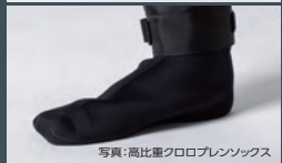
写真:高比重クロロプレンソックス