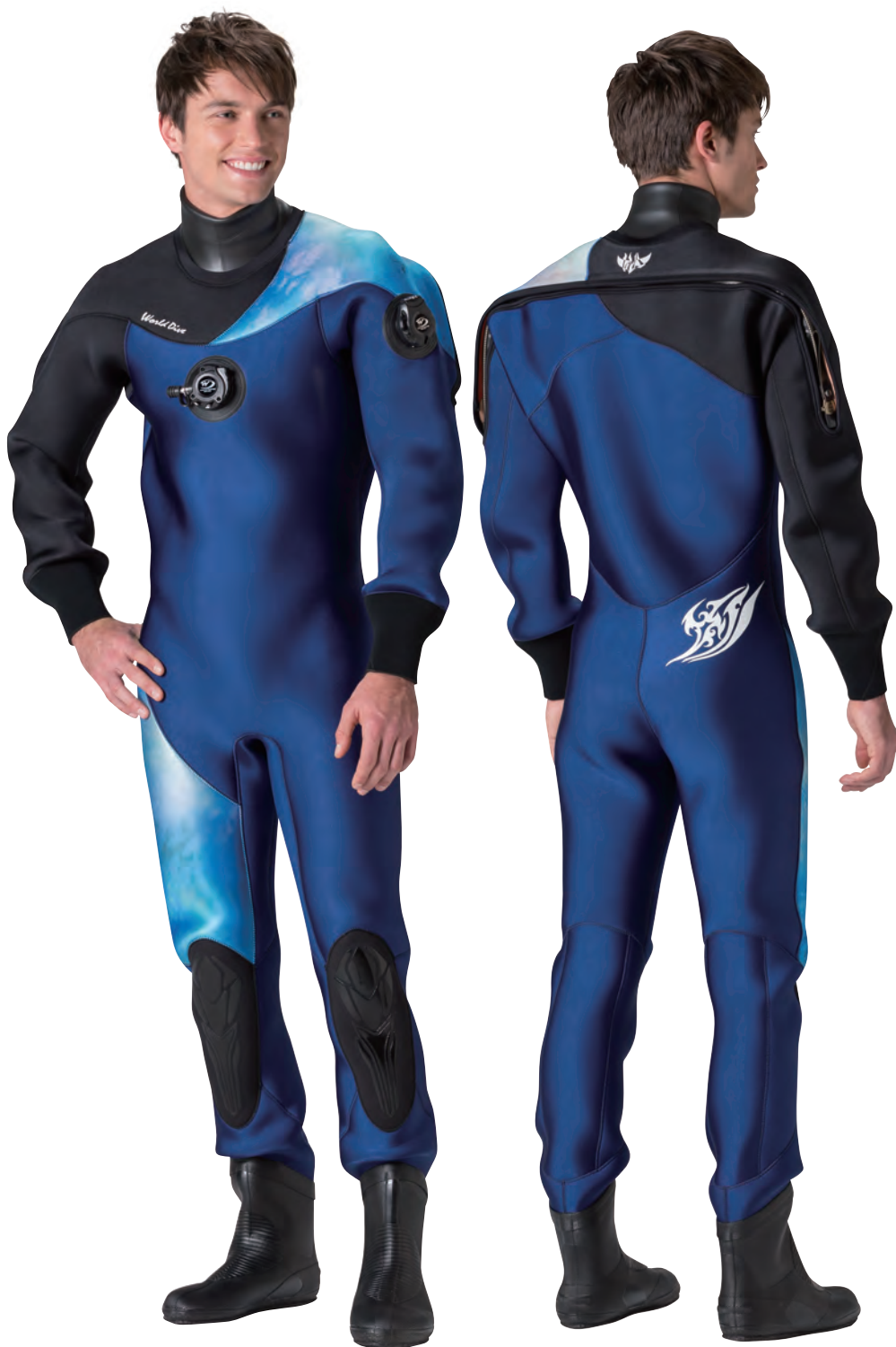
▲ネイビー(G)×タイダイブルー(P)×ブラック(G)

肩と右ふとももにプリント柄をチョイスできる非対称デザイン。メイン素材はグロッシーフाइバー。裏地は保温性の高いマルチエラストックスか、抗菌防臭機能を備えたリブフレッシュPから。