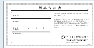
※ドライスーツは白、ウエットスーツは水色の台紙です