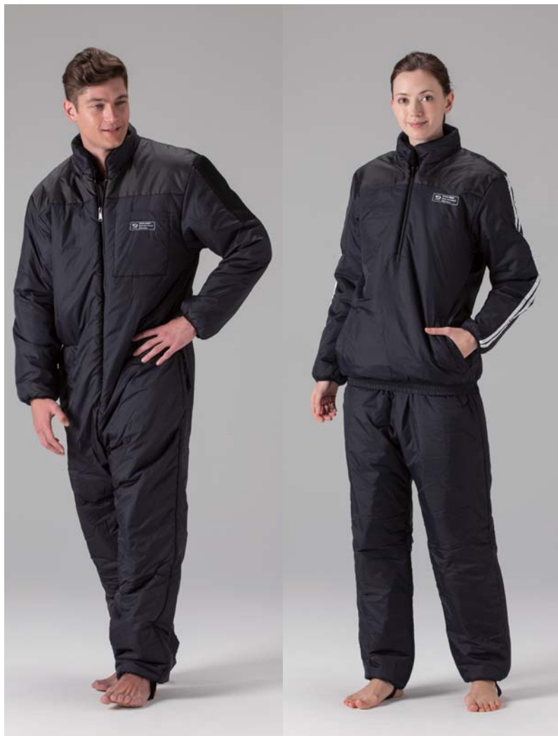
ボディ・ヒート・ガード ワンピースタイプ ボディ・ヒート・ガード ツーピースタイプ

対スキズに負けない「3M™シンサレート™」を使用して、保温性と運動性を両立させた機能インナースーツです。