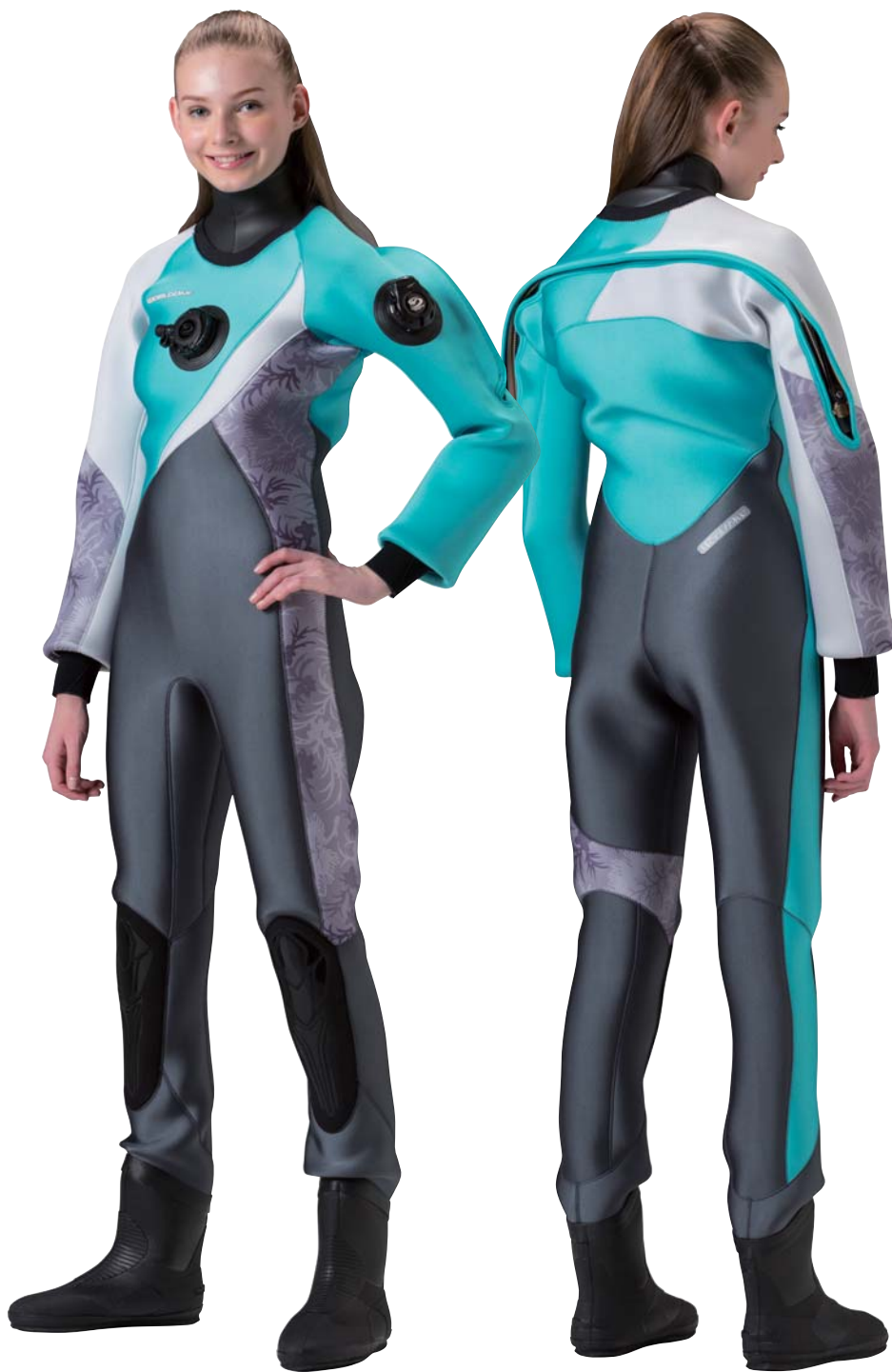
▲ネオグレイ(G)×ビスタチオ(G)×ポタニカルグレイ(P)×ホワイト(G)

海でもおしゃれを求めたい女性ダイバーのために、左右非対称の画期的なパネル構成でデザイン性をグーンと高めました。メイン素材は発色のきれいなグロッシーファイバー。裏地は、女性には嬉しい起毛保温素材マルチエラストックスか、抗菌防臭機能を備えたリブフレッシュPから。