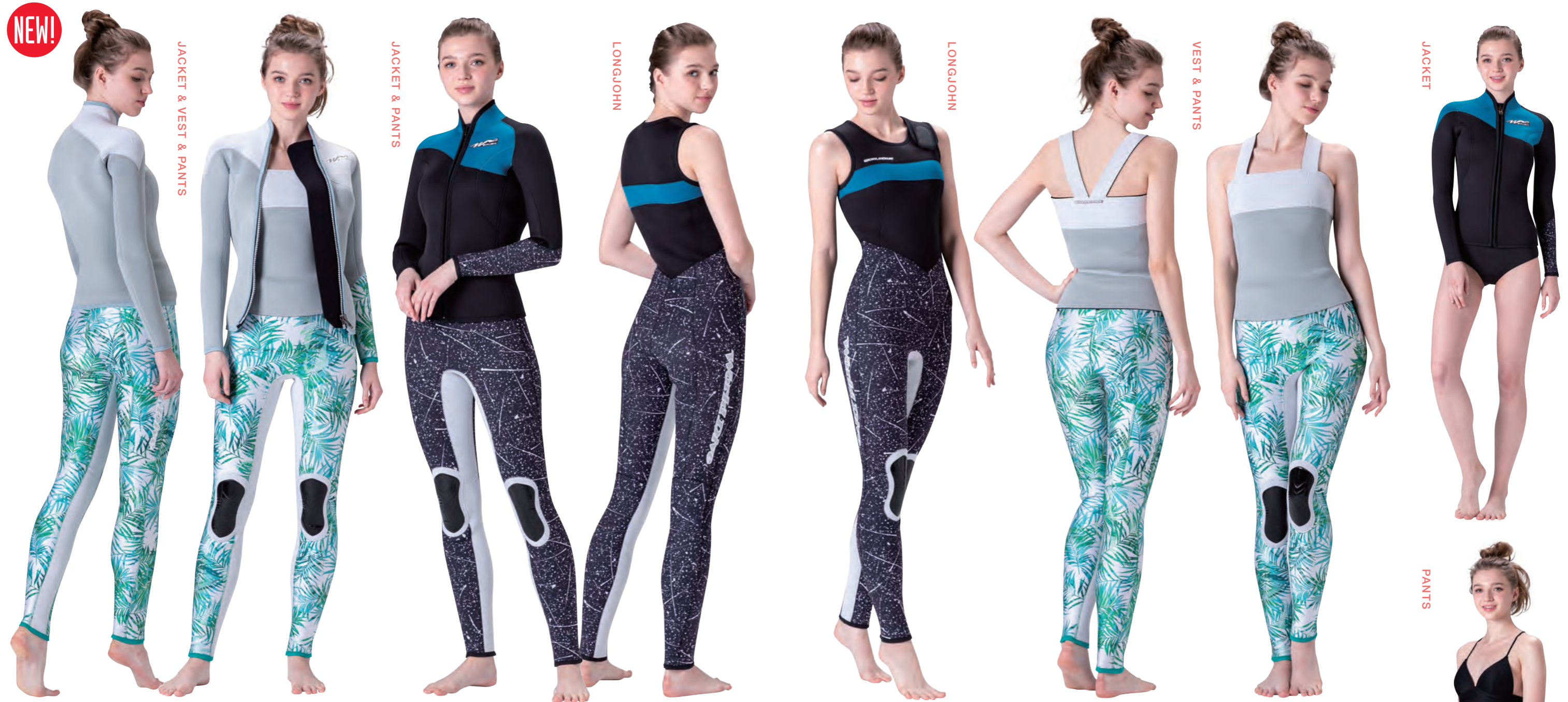
▲3ピース PRICE ① ●ジャケット:シルバー(SJ)×ホワイト(SJ)×パームグリーン(P) ●ベスト:シルバー(SJ)×ホワイト(SJ) ●パンツ:パームグリーン(P)×ホワイト(SJ)

セットアップ次第で、エレガントにもキュートにも、とっておきのスーツに変身します。