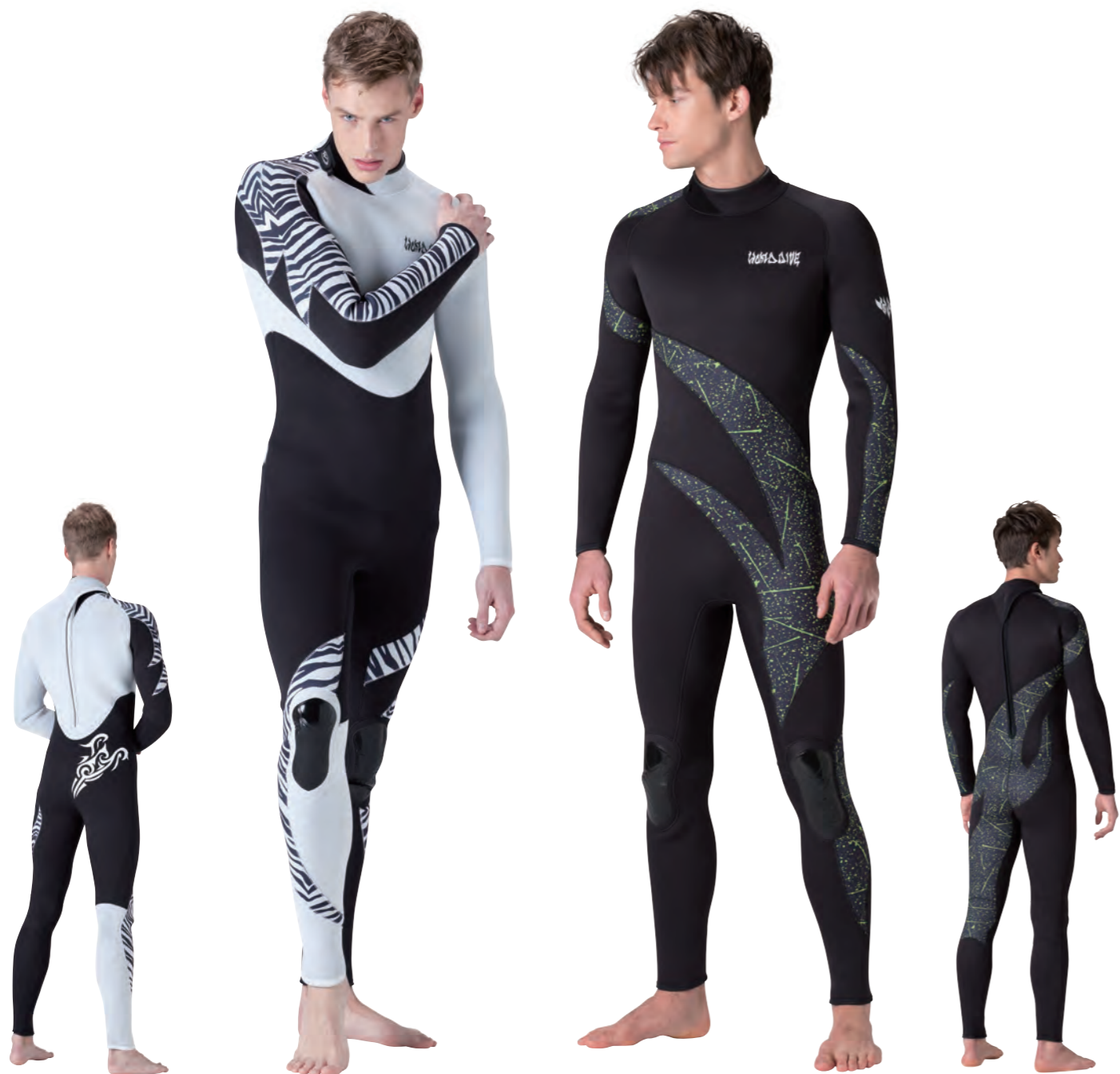
▲ホワイト(SJ)×ブラック(SJ)×ゼブラホワイト(P)