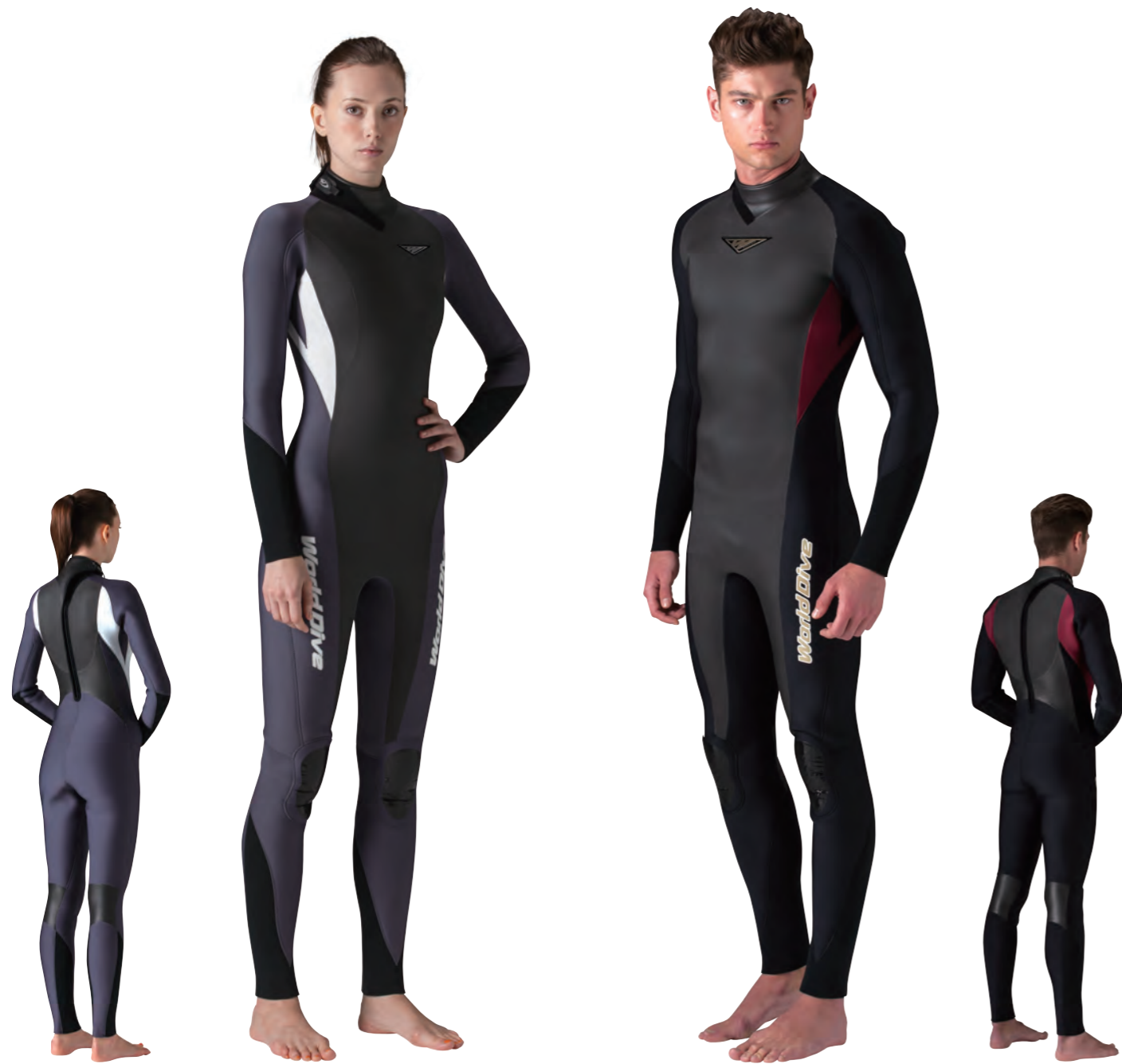
▲チャコールグレイ (FE)×ホワイト (FE)