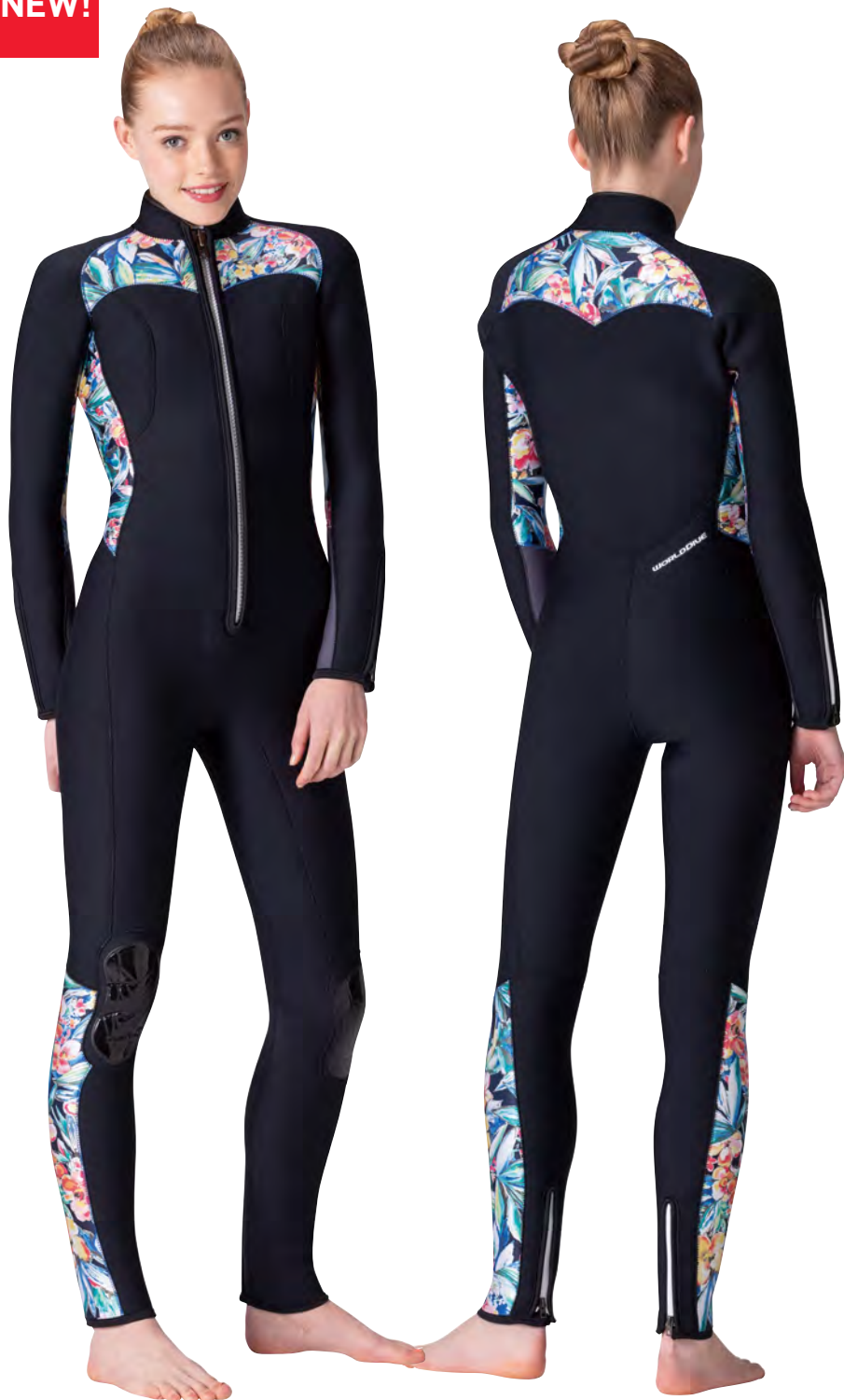
▲ブラック(FE)×トロピカル(P)×チャコールグレー(FE) フロントファスナー:当て布・ボーダーネイビー/ファスナー・ホワイト ※手首・足首ファスナーはオプション

STANDARD ENERGY FABULOUS FIBER MULTI ELASTEX プリント柄 PRINT WAVESTAPE FRONT FASTNER