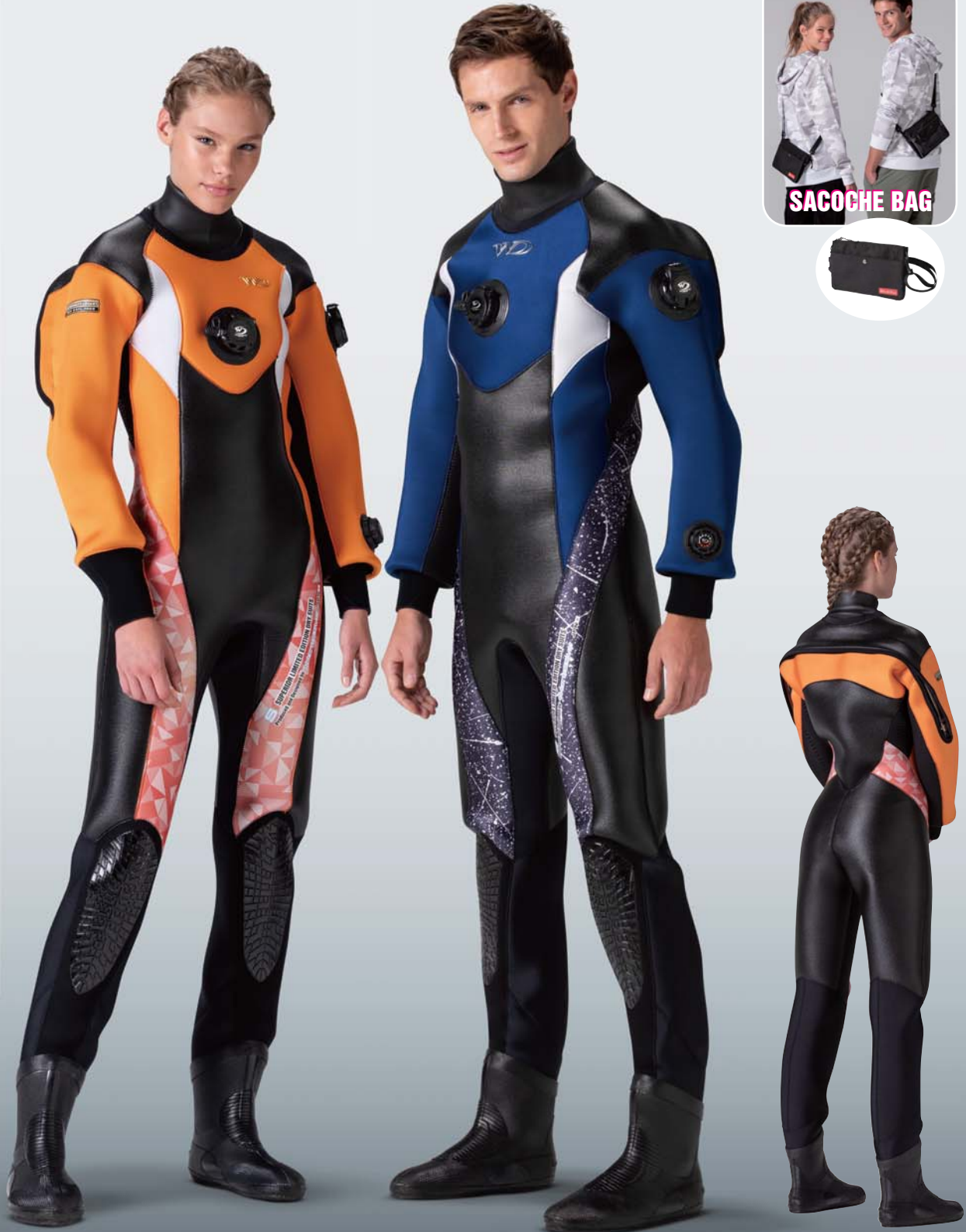
▲ネオオレンジ(G)×トライアングルオレンジ(P)×ホワイト(G)