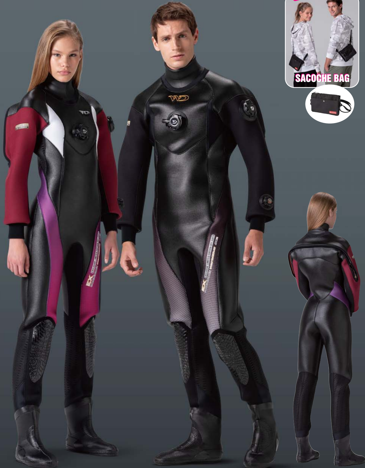
▲ワイン(タフα)×グラデメッシュパープル(P)×ホワイト(G)