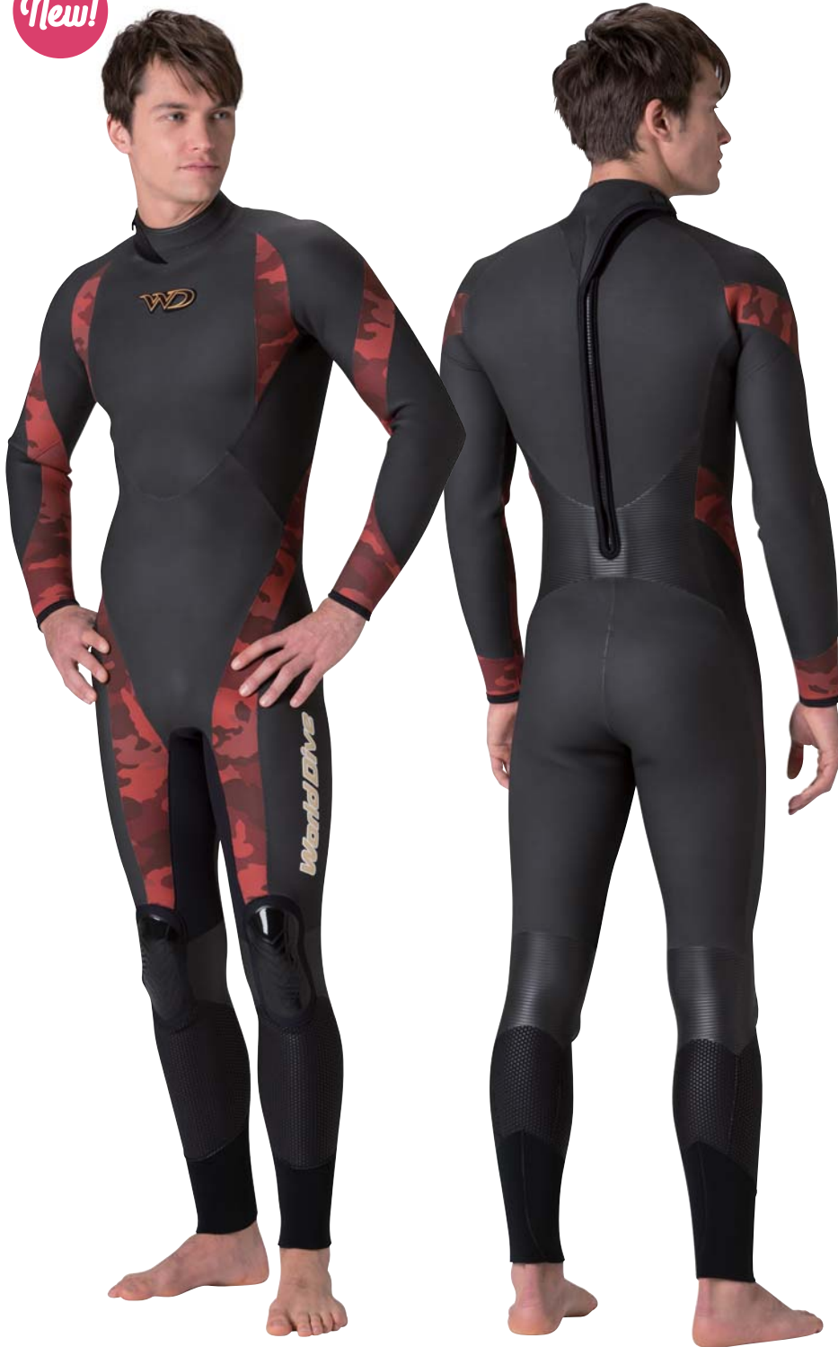
▲ダークカモレッド(P)×ブラック(ZF)