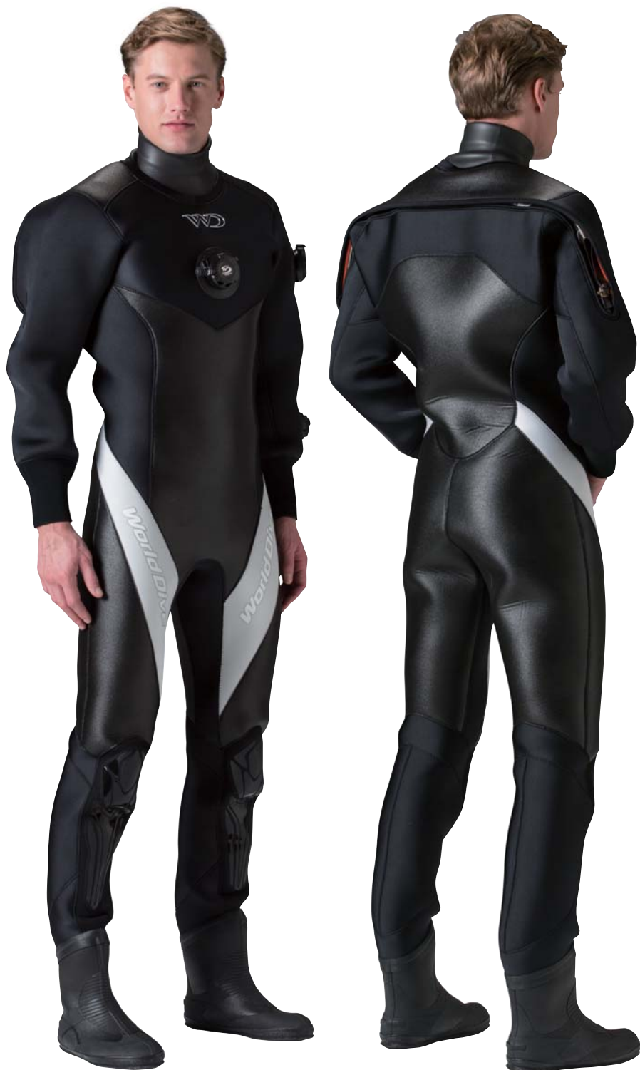
▲ブラック(G)×ホワイト(G)

前後のメイン素材に水キレがよく耐久性に優れるソフトラジアル、裏地には起毛保温素材マルチエラステックスの組合せで抜群の保温力を発揮。