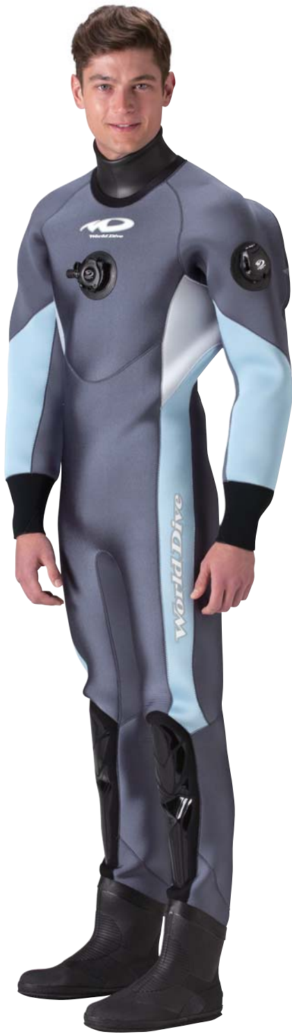
▲ネオグレイ(G)×ホホワイト(G)×アイスブルー(G)