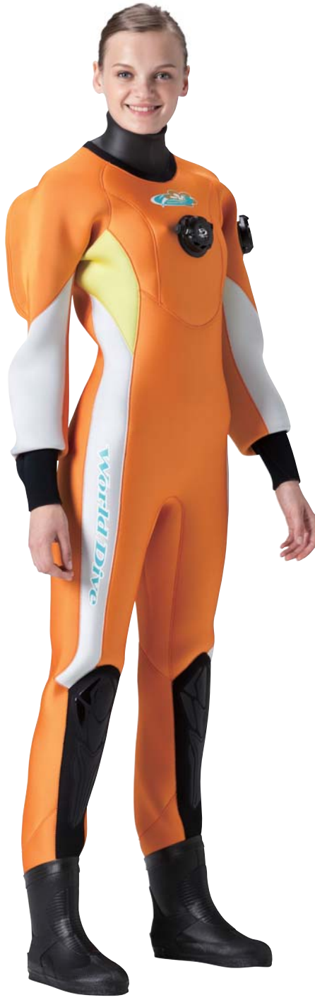
▲ネオオレンジ(G)×レモンイエロー(G)×ホホワイト(G)

サイドをストレートに流れるパネル構成のシンプルなデザイン。3色づかいでカラーリングも楽しめるエントリーダイバーにおススメのドライです。メイン素材には発色が美しいグロッシーフイバー。裏地は、抗菌防臭効果の高いリブフレッシュPを採用しました。気になるスーツ内の臭いも安心です。