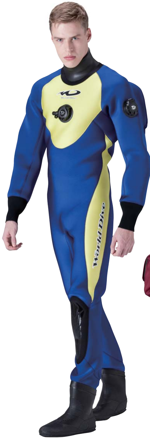
▲ネイビー(G)×レモンイエロー(G)

サイドの流れるラインが特長のシンプルなデザインで、2色づかいのパネル構成にしました。発色のいいグロッシーフाइバーをメイン素材に、裏地にはスーツ内をいつも清潔にキープする抗菌防臭効果に優れたリブフレッシュPを採用。エントリーダイバーにも最適の1着です。