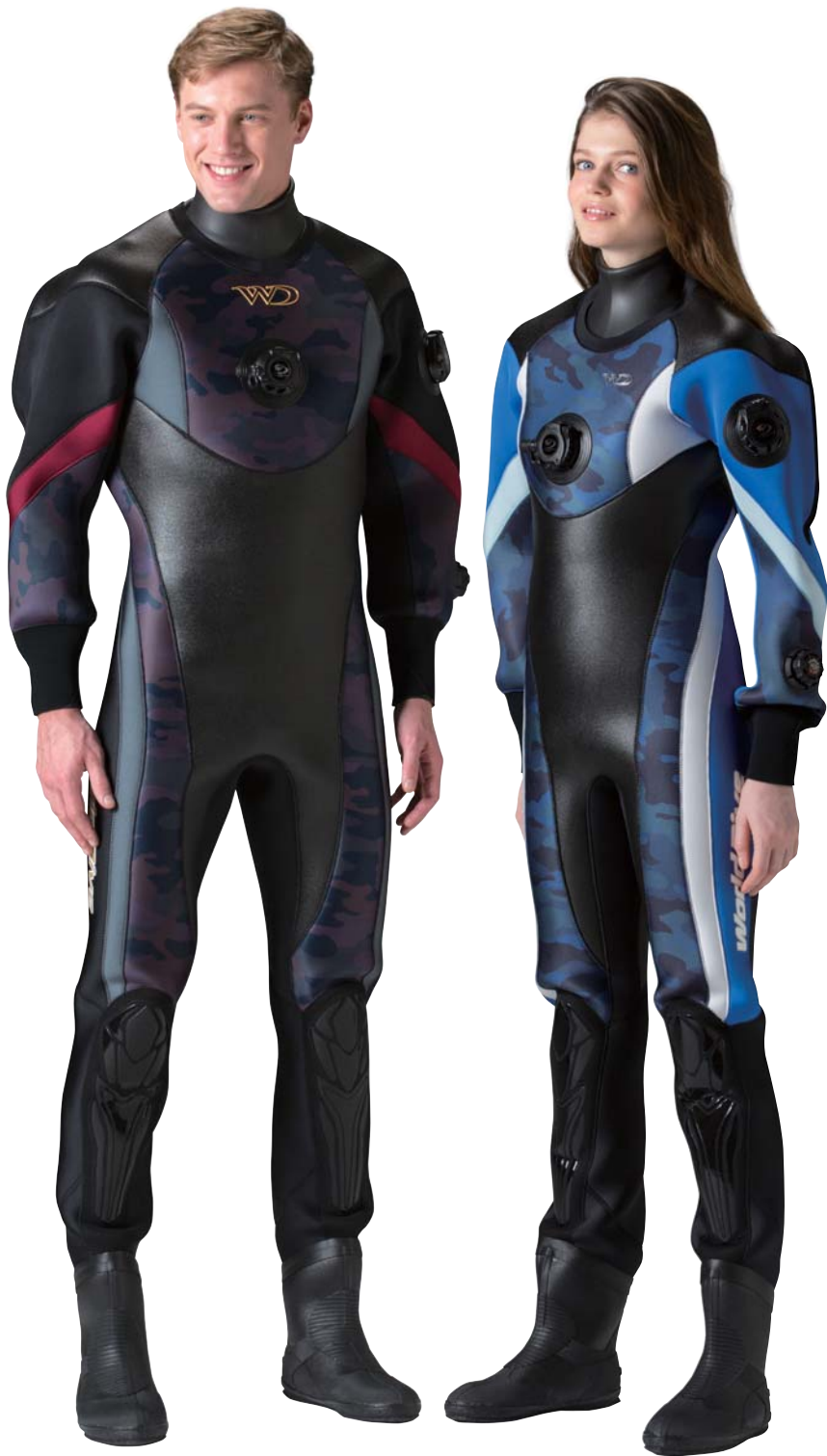
▲ダークカモブラック×ブラック×ネオグレイト×ワイン